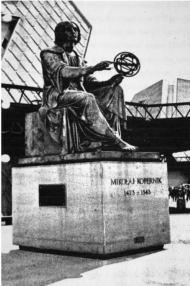
Pomnik Kopernika w Montrealu