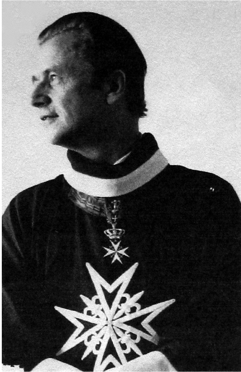
W stroju Kawalera Mieczowego