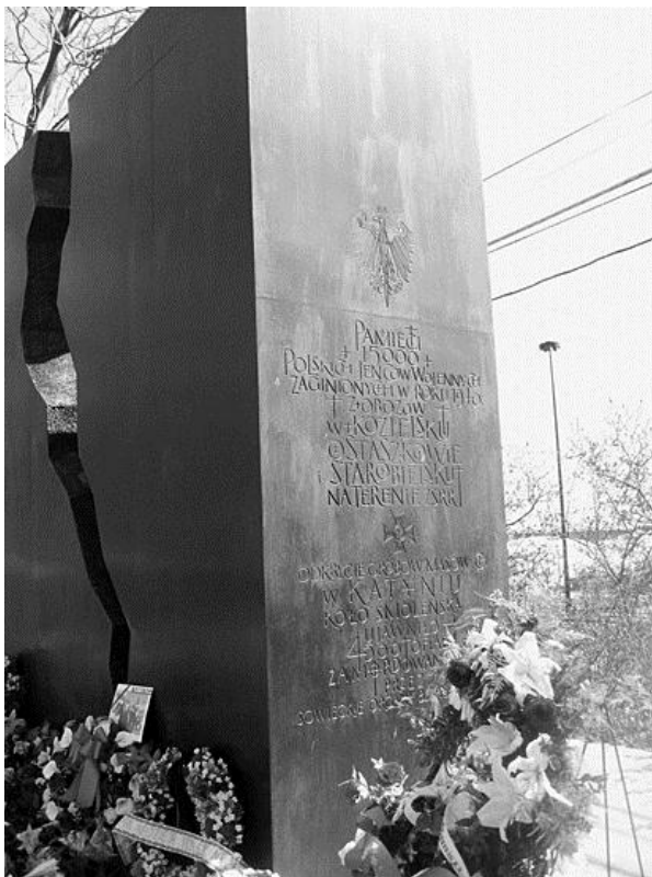
Pomnik Katyński, Toronto