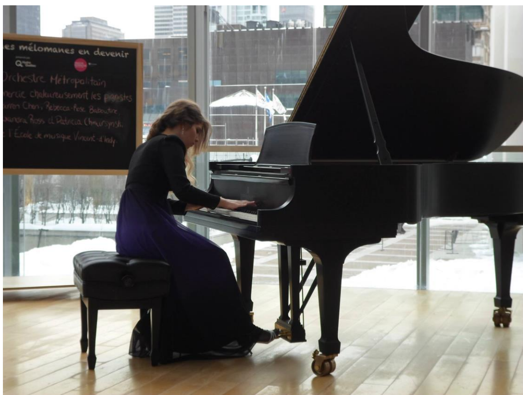
Maison Symphonique na Place des Arts, tuż przed koncertem z Metropolitan Orchestra