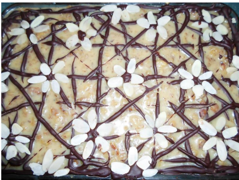
Mazurki chopinowskie i mazurki wielkanocne- oba doskonale w wykonaniu Patrycji