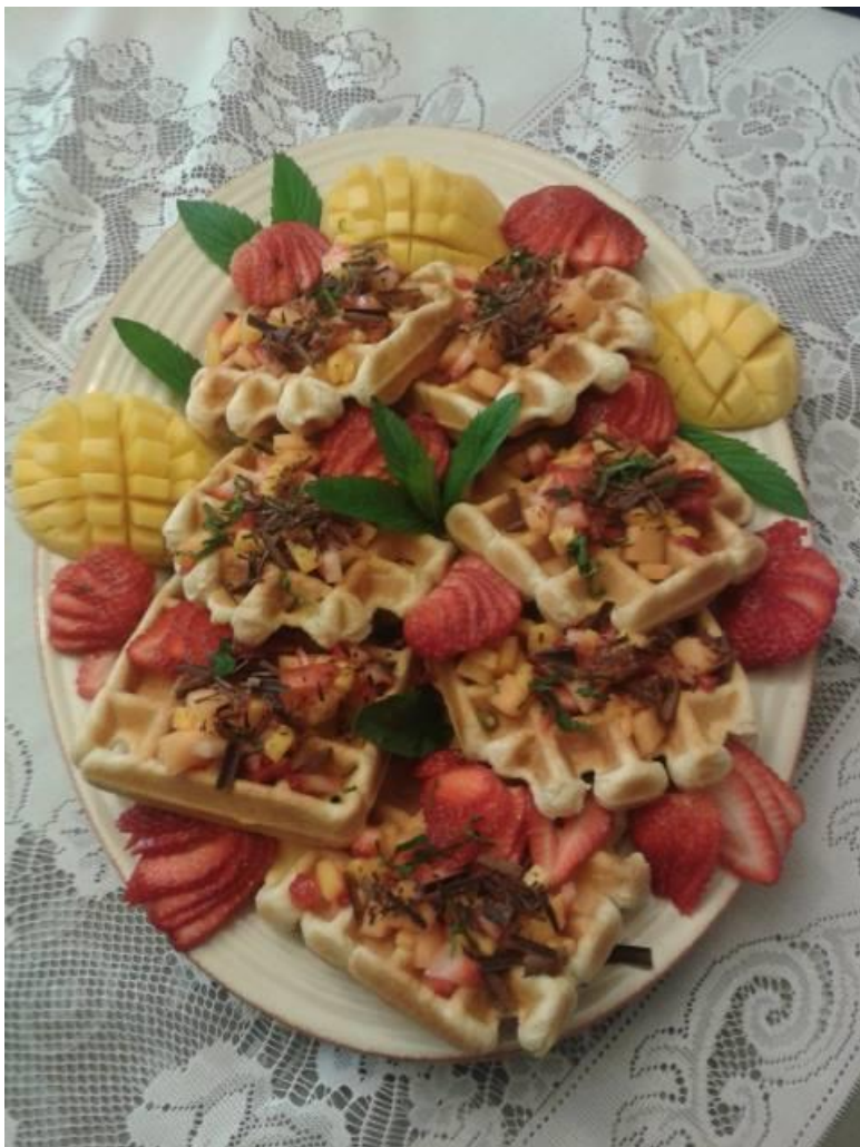
Sobotnie gofry Patrycji z owocami i czekoladą, którymi można rozkochać niejedno serce...