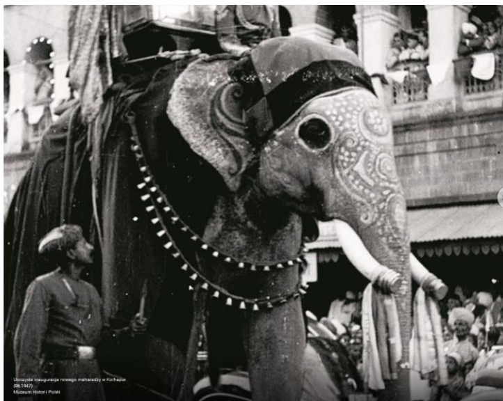
Uroczysta inauguracja nowego maharadży w Kolchacie (18-1942)

W czasie sześcioletniego pobytu w Indiach polscy uchodźcy mieli okazję różnych kontaktów z hinduską społecznością. Po początkowej wzajemnej nieufności, często nawiązywane były dobre, a nawet przyjazne relacje. Zawiazano się nawet kilka małżeństw polsko-hinduskich. Hindusi byli najczęściej nauczycielami angielskiego, dużą grupę stanowili też lokalni mieszkańcy, którzy pracowali w osiedlu lub zajmowali się handlem – na peryferiach Valivade powstał nawet duży bazar z hinduskimi straganami. Większe możliwości nawiązania bliższych relacji były w Balachadi, gdzie oddelegowani przez maharadżę Hindusi pracowali też jako lekarze, kucharze czy nauczyciele muzyki (ok. 50% obywateli osiedla stanowili miejscowi).